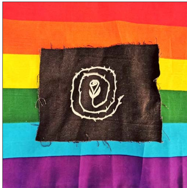
The fabric with the sigil was a gift from the Reclaiming Pittsburgh community.